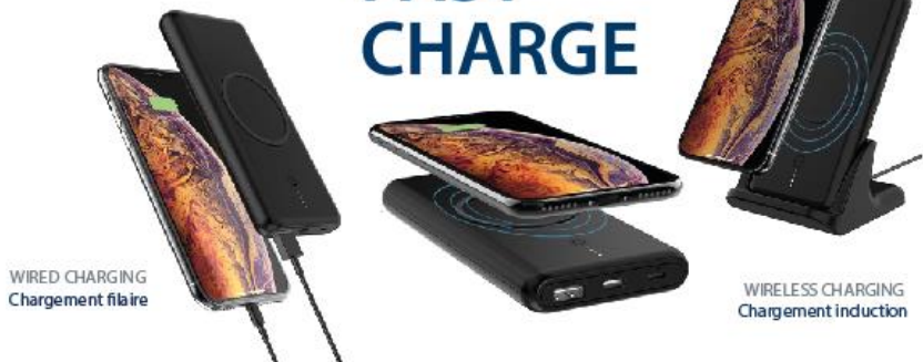
WIRED CHARGING Chargement filaire