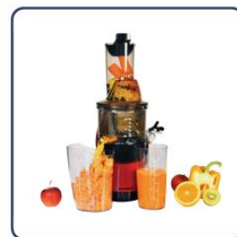
wyciskarka do soków