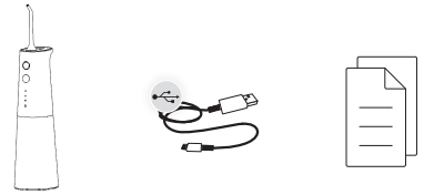
본품 x1 C타입 케이블 x1 사용 설명서 x1